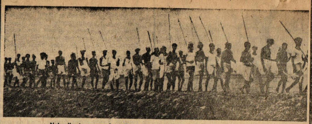
Naksalbari saveaşçıları; Bir halkın ordusu yoksa hiç bir şeyi yoktur.

... min Naksalbari yöresinde başlayan devrimci